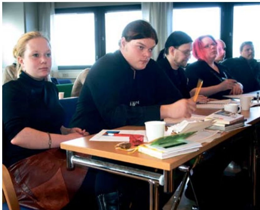
Internetillä on entistä tärkeämpi rooli etenkin nuorten tavoittamisessa.