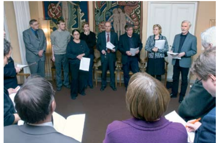
Herttoniemeläisten asukkaiden tonttivuokratoimikunta vetosi kaupunginvaltuustoon tonttivuokrien kohtuullistamiseksi.

Satojen asuintalojen tonttien – muun muassa Herttoniemen, Käpylän, Maunulan, Mellunmäen, Myllypuron, Puotilan, Ruskeasuon, Roihuvuoren, Vartiokylän,