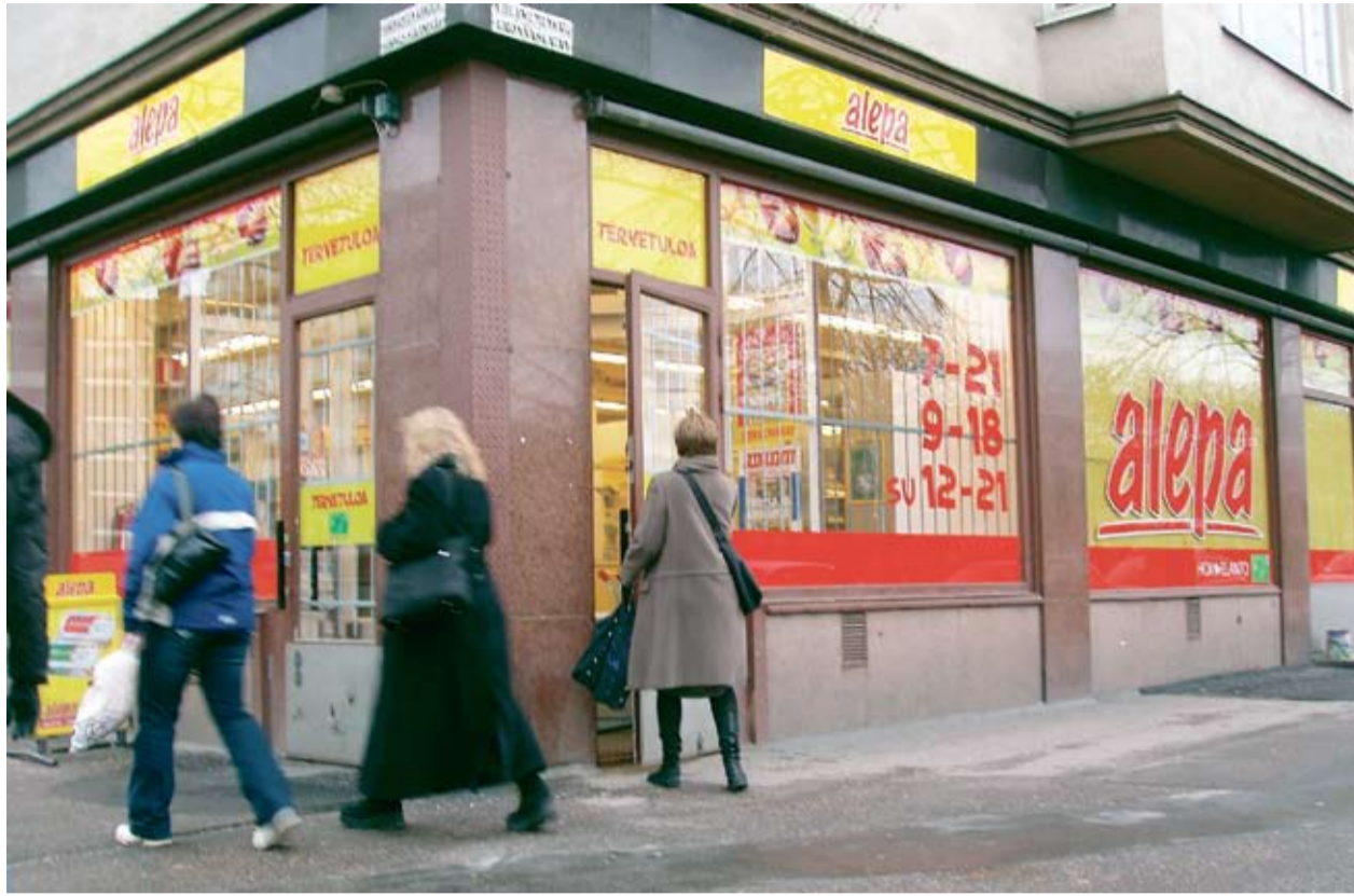
Hukkaako osuusliike edistykselliset perinteensä kovaan markkinakilpailuun?

jen keskittämistä suuriin kauppa-keskuksiin etäälle asuinalueista. Siinä ehdotetaan myös joukko-liikenteen käyttäjille bonusetuja, joita nyt kertyy vain tankatessa yksityisautoa.