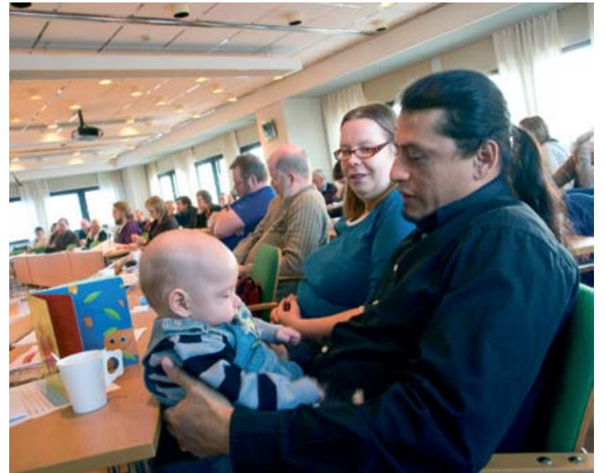
Asukaslistan, naislistan, kulttuurilistan ja SKP:n aktiiveja kokoontui tammikuun lopulla keskustelemaan voimien yhdistämisestä 26.lokakuuta pidettävissä kunnallisvaaleissa.