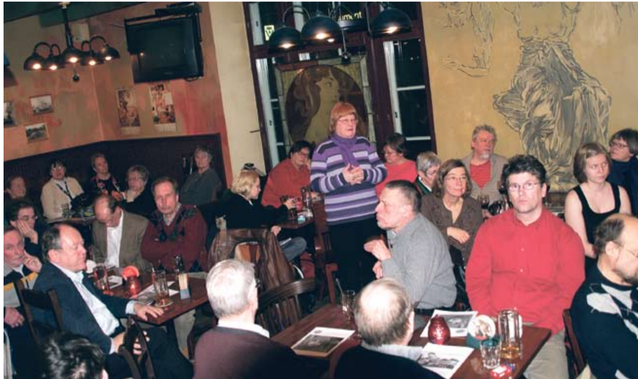
Maanantaiklubi on kriittisen keskustelun ja kulttuurin avoin kohtaamispaikka.

kaamaan alueen kartan uuteen uskoon pilkkomalla nykyiset Lähi-idän valtiot pienemmiksi etnisten ja uskonnollisten rajalinjojen mukaisesti. Tällöin ne ovat helpommin hallittavissa, ja myös Israel voi uskontoon pohjautuvana valtiona perustella paremmin arabien ja palestiinalaisten karkoittamisen alueeltaan.