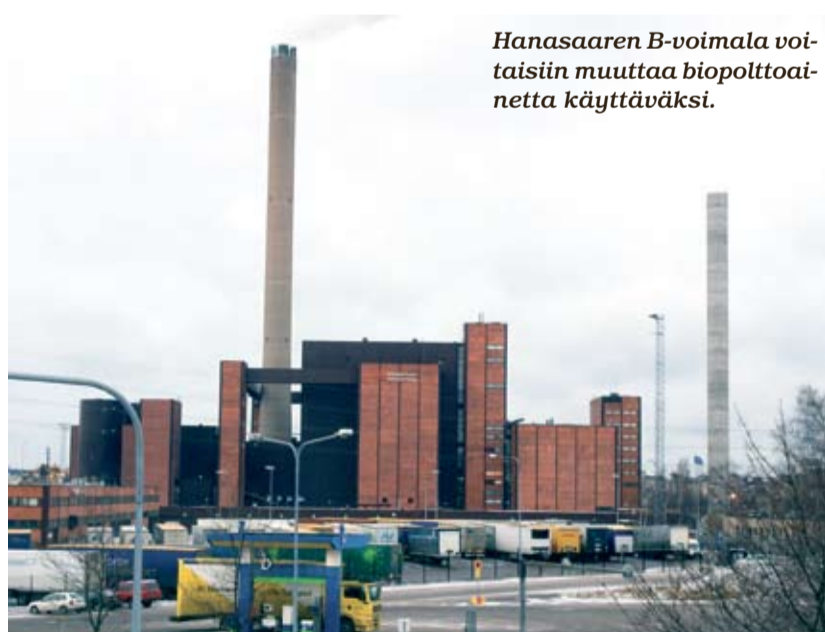
Hanasaaren B-voimala voitaisiin muuttaa biopolttoainetta käyttäväksi.