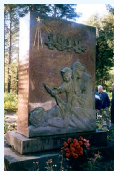
Vuosina 1918-1919 vankileirillä menehtyneiden punaisten muistomerkki Santahaminassa.

Sotilasalueelle pääsyn takia tapahtumaan tulee ilmoittautua ennalta Sen voi tehdä SKP:n Helsingin piiriin puh (09) 7743 8140 tai helsinginpiiri@skp.fi