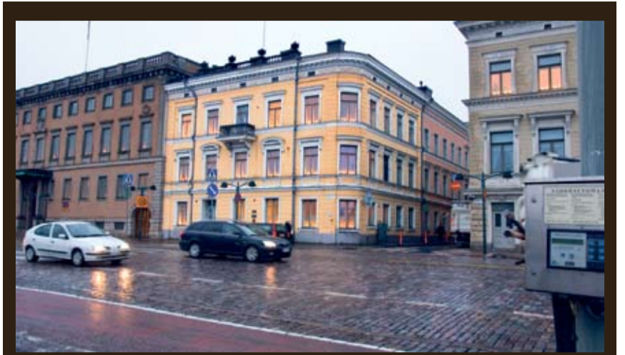
Lampan talo on vuodelta 1817.