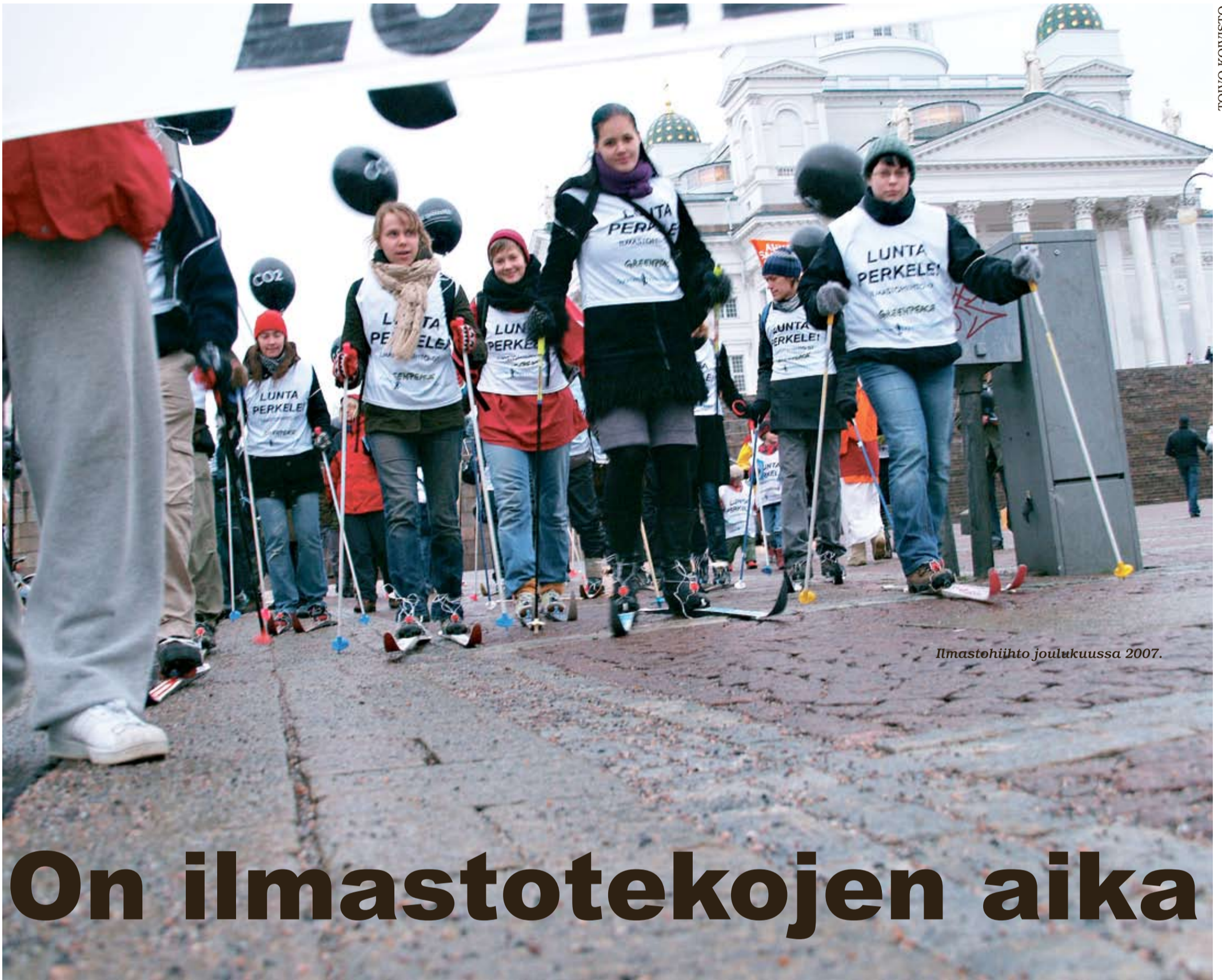
Ilmastohiihto joulukuussa 2007.