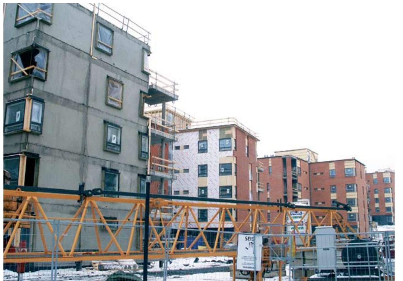
Helsingin asuntotuotantoa hallitsevat isot rakennusliikkeet, kuten NCC, Skanska, SRV ja YIT.

SKP:n ja asukaslistan ryhmä toisti esityksensä kaupungin oman rakennusosaston tai pääkaupunkiseudun kuntien yhteisen rakentamisen liikelaitoksen perustamisesta. Kaupungin oman rakennustoiminnan tarvetta korostaa se, että uusien asuntojen hinnat nousevat nykyisin selvästi nopeammin kuin rakennusalan palkat