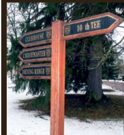
Golfseura maksaa 6 700 euroa vuodessa vuokraa Talin kartanon alueesta rakennuksineen.